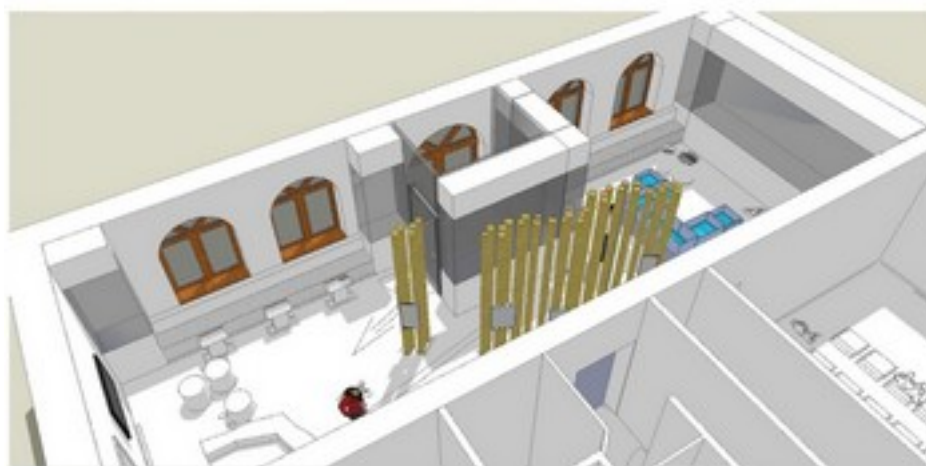
KONCEPCJA ARCHITEKTONICZNA - PUNKT INFORMACJA TURYSTYCZNEJ GŁUSKO