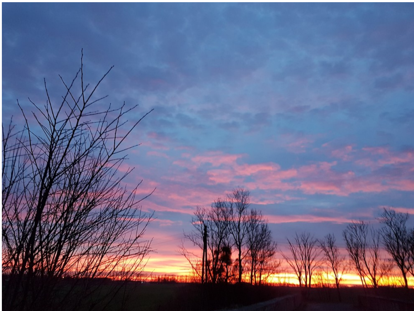
Styczniowy dzień nad Drawą, a w powietrzu jakby wiosna.