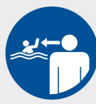
nakaz ustawicznego nadzoru nad dziećmi