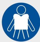
nakaz nakładania kamizelek ratunkowych